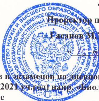
График комиссионных пересдач зачетов и экзаменов на дневном отделении биологического факультета (2020-2021 уч.год) напр. «Биология» 1 курс