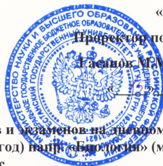
График комиссионных пересдач зачетов и экзаменов на дневном отделении биологического факультета (2020-2021 уч.год) напр. «Биология» (магистратура) 1 курс